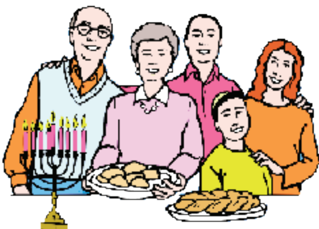
Hanouka, fête juive des lumières

Dans toutes les religions les fêtes sont l'occasion de réjouissances autour du repas.